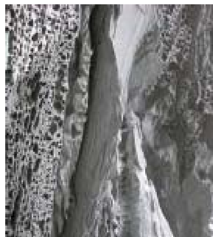
Beispiel für die Lochverwitterung, die in der Regel an trockenen Felshängen entlang der Gesteinsschichtung kleinste Risse oder Unstetigkeiten im Gestein nachzeichnet. Sie wird durch Sickerwasserbewegungen, Salzbildungen oder thermische Effekte hervorgerufen.