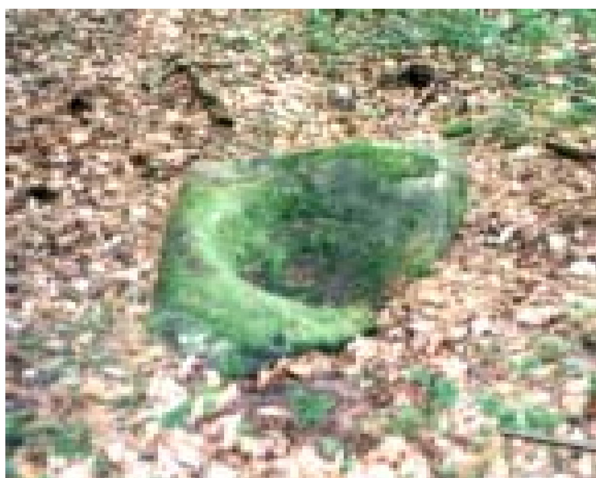
Der Frau-Holle-Stein auf dem Högberg.

Auf dem Högberggrücken liegt einer (von früher dreien) Frau-Holle-Steinen. Wie dieser Findling mit der beckenartigen Vertiefung hierher kam, ist unbekannt. In Oberbessenbach erzählte man den Kinder, es schneie, wenn Frau Holle hier ihre Betten ausschüttele.