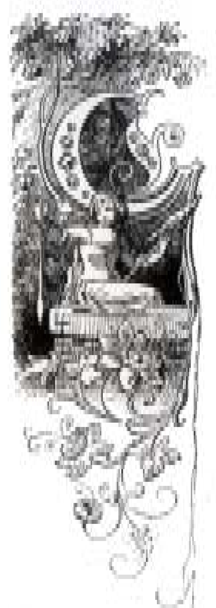
Goldmarie am Brunnenrand; Szene aus Frau Holle von Eugen Neureuther.

Vom naturwissenschaftlichen Standpunkt aus gesehen, gibt es für solche Gesteinsformen eine Erklärung. Eine solche Verwitterungsform wird unter anderem als Napfverwitterung bezeichnet. Im Gegensatz zur Lochverwitterung, die in der Regel an trockenen Felshängen entlang der Gesteinsschichtung kleinste Risse oder Unstetigkeiten im Gestein nachzeichnet, findet die Napfverwitterung auf flachen konstanten Oberflächen statt. Sie steht im Zusammenhang mit Flechten, Algen schließlich Moosen, die sich durch die Konzentration von Feuchtigkeit auf der flachen Oberfläche ansiedeln. Organische Säuren und Feuchtigkeit bedingen eine chemische Verwitterung (hydrolytische Verwitterung), welche immer mehr eine Hohlform schafft. Dadurch kommt es zu einem positiven Rückkopplungseffekt, da sich in der tieferen Hohlform wieder mehr Wasser ansammeln kann und damit die Ansammlung weiterer feuchtigkeitsliebender Pioniere begünstigt wird. Wenn heute keine Moose und Flechten mehr vorhanden stellt keinen Widerspruch dar. Es zeigt nur an, dass sich die Bedingungen im Umfeld zu einem trockenerem Milieu mit erhöhter Verdunstung und Trockenfallen des Steins gewandelt haben.