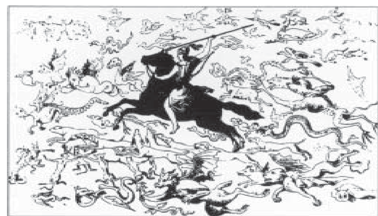
Frau Holle / Hulda mit ihrem Geisterheer.

Frau Holle erscheint erstmals in einem Text von Burchard von Worms (960-1025), wo er die römische Göttin Diana mit „Holle“ oder „Hulda“ übersetzt. In mittelhochdeutschen Texten um 1200 bedeutet das Wort „Holde/Holle“ soviel wie Geist oder Dämon.