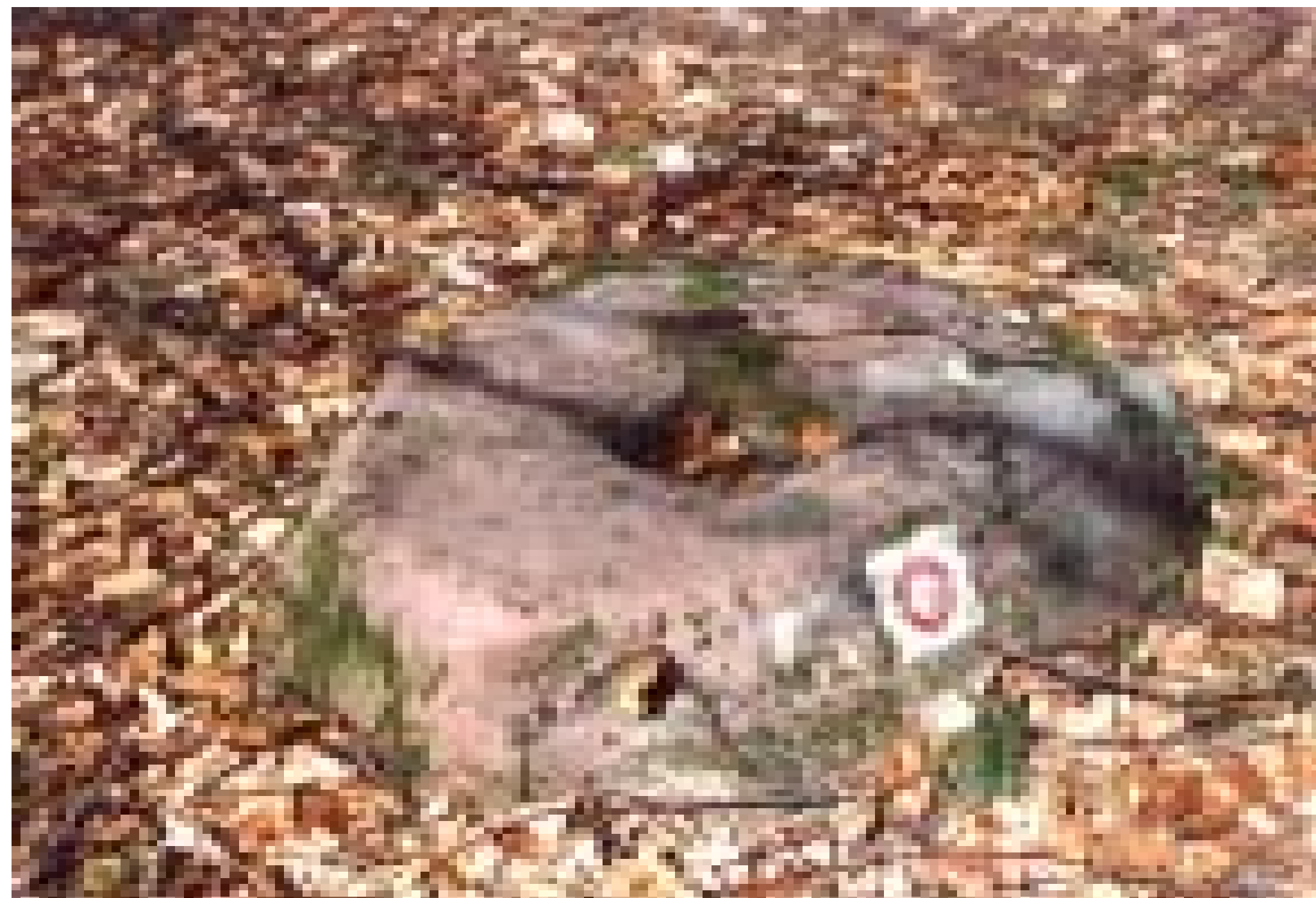
Die Waschschüssel der Frau Holle zwischen Heimbuchenthal und Krausenbach, vermutlich ein Tegelstein, in dem ein Bildstock verankert war.

Bei Tiefenstein erzählt man sich die Geschichte von den drei Handwerksburschen auf der Walz, denen Frau Holle im Wald begegnet und denen